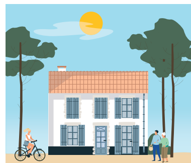
*Comité Local pour le Logement Autonome des Jeunes

Cela prend du temps mais la résidence habitat jeunes n'est plus un projet, c'est bientôt une réalité. Depuis mars et pour un an, l'ancienne maison de retraite testée en résidence jeunes puis fermée pour cause de vétusté est en cours de réhabilitation : un programme architectural vertueux (isolation, eau chaude solaire) et un plan de circulation bien pensé entre les communs et les 15 lits (11 chambres, 2 T2). Géré par le CLLAJ*, c'est une solution d'hébergement temporaire et très peu coûteuse pour des jeunes en « décohabitation familiale », en couple ou en insertion professionnelle, disposant de peu de ressources. Les travaux (1,1 M€ TTC) sont réalisés dans un partenariat entre commune, CdC (171 600 €), Département, État, Région, Europe. Habitat 17 en est le maître d'ouvrage.